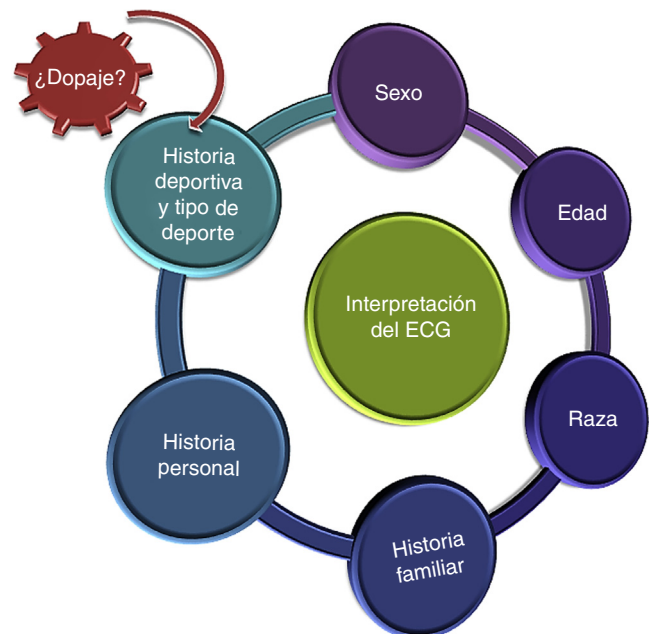
Figura 1. Contexto de interpretación del ECG del deportista. ECG: electrocardiograma.

Una de las innovaciones del documento es la inclusión de consideraciones específicas en la interpretación del ECG de deportistas de 12 a 16 años (patrón juvenil) y de edad \geq 30 , en los que la prevalencia de enfermedad coronaria aumenta considerablemente.